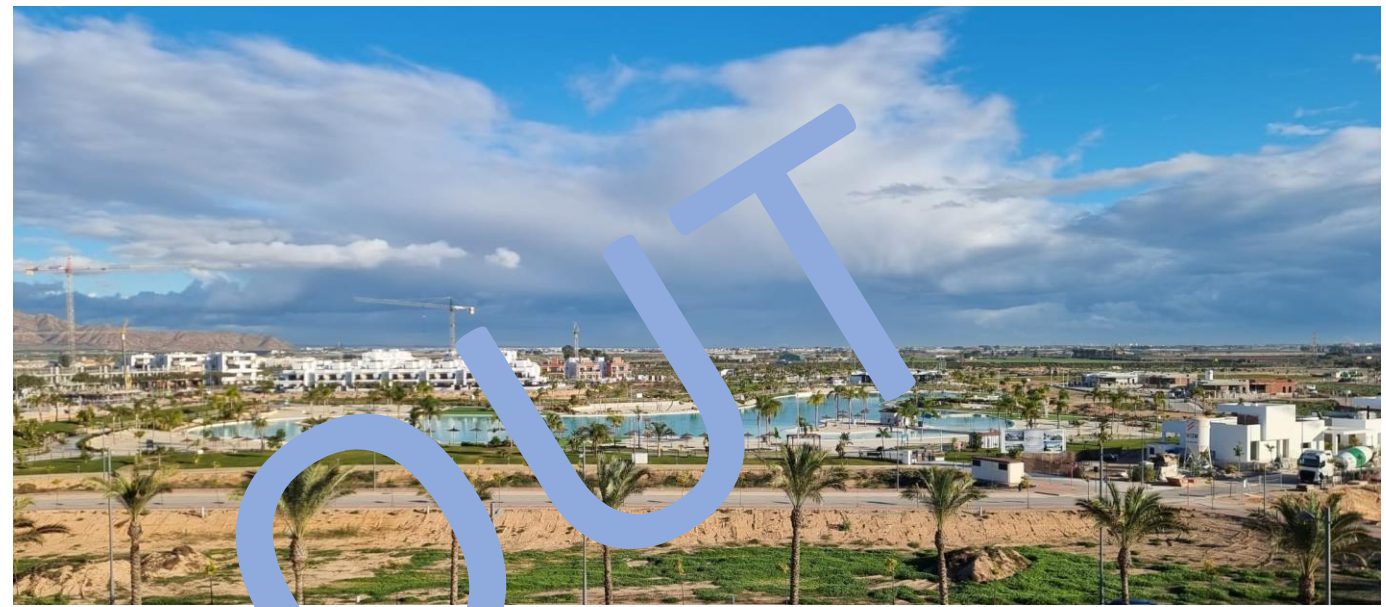
Views from the penthouse