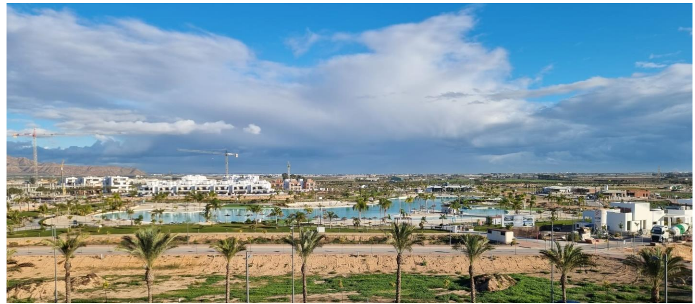
Views from the penthouse